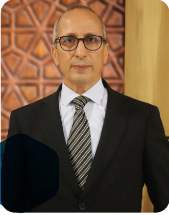
Pr Belaid Bougadir