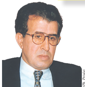
Pr. Mohammed GERMOUNI

Retour à la question de l'endettement en ces temps complexes de crise